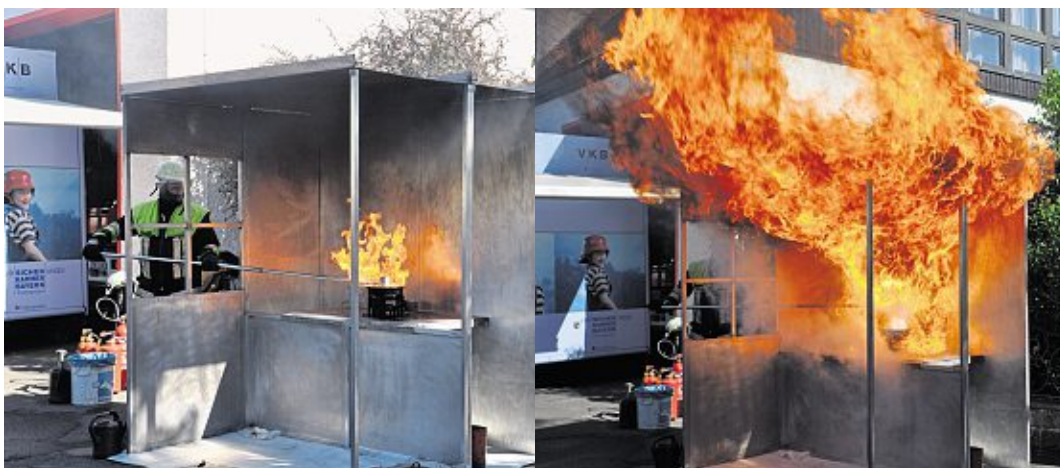
Dies passiert, wenn zuhause am eigenen Herd jemand einen Ölbrand am heimischen Topf mit Wasser löschen will, eine riesige Stichflamme, die die ganze Wohnung in Schutt und Asche versetzen kann. Anschaulich wurde die vielen Gefahren im Umgang mit Fetten und Öl gezeigt. Bleibt zu wünschen, dass dieser Fall den Lehrgangsteilnehmern erspart bleibt. (jr)