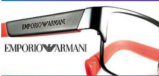
Abb. west.49