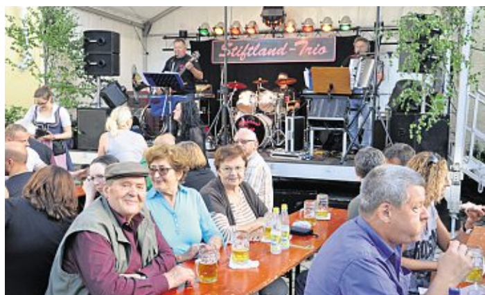
Das „Stiftland-Trio“ sorgte am Samstagabend wieder einmal für Stimmung und gute Laune.